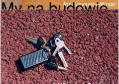
Nawierzchnie przyżyczenia w Nowym Sączu