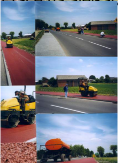
Pracownia Lepiszczy Bitumicznych - Kolorowe Nawierzchnie