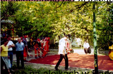
Pracownia Lepiszczy Bitumicznych w Parku Szczęśliwickim w Warszawie