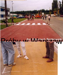
Próby w Warszawie (1999)