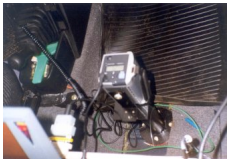
Fot. 3. Pirometr