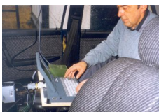
Fot. 5. Stanowisko Operatora