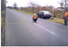
Fot. 1. Pomiar Poprzedniego Rozkładu Temperatury Nawierzchni