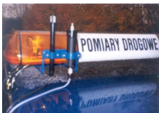
Fot. 4. Czujnik Parametrów Atmosferycznych (Zespolony Czujnik Temperatury i Wilgotności oraz Czujnik Ciśnienia)