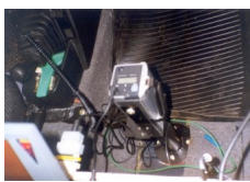
Fot. 3. Pirometr