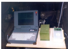
Fot. 2. Pulpit Operacyjny