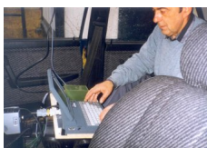
Fot. 5. Stanowisko Operatora