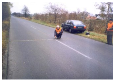
Fot. 1. Pomiar Poprzedniego Rozkładu Temperatury Nawierzchni